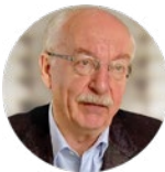
GAST Gerd Gigerenzer Psychologe

Kopf oder Bauch? Wir treffen jeden Tag Entscheidungen und glauben, sie beruhen auf der rationalen Abwägung sachlicher Argumente. Doch das ist ein Irrtum! Viel öfter hören wir auf unser Gefühl. Und damit fahren wir meistens auch ganz gut, denn viele Risiken können wir gar nicht exakt abschätzen.